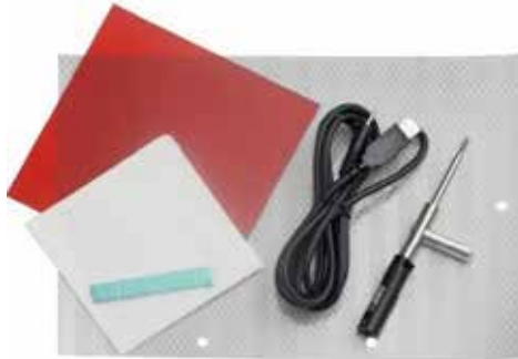
OSID-INST Lazer Kurulum Kiti