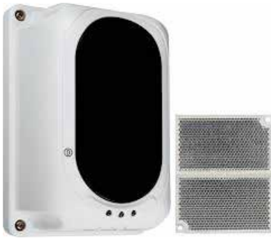
Işın Tipi Duman Dedektörü