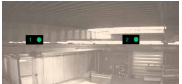
CMOS sensörlü otomatik hizalama ve 7 adede kadar vericiye bağlanabilme imkanı