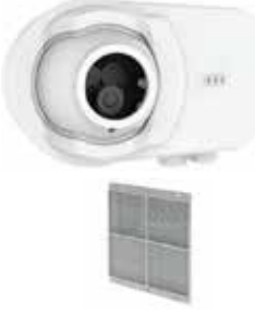
OSID-RE Alıcı Ünitesi