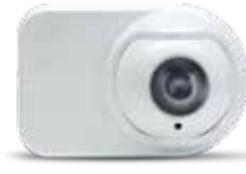
OSI-90: Alıcı Ünitesi