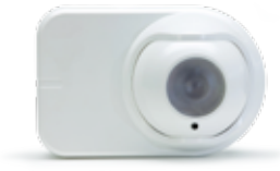
OSI-10 Alıcı Ünitesi